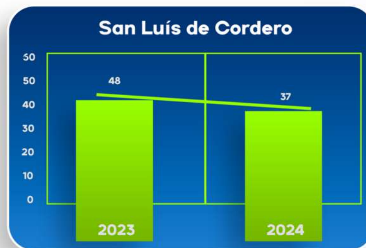
Total de solicitudes de información pública ingresadas a la Unidad de Transparencia

3. La titular de la UT no cuenta con los requisitos del perfil del puesto.