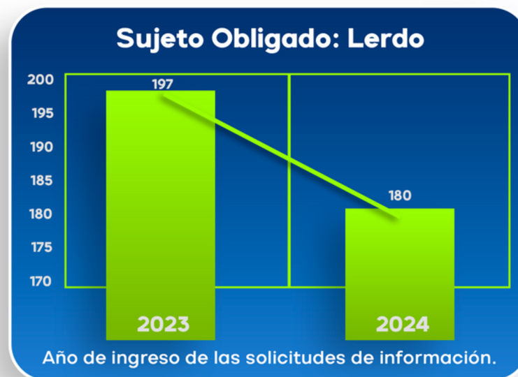
Total de solicitudes de información pública ingresadas a la Unidad de Transparencia

Durante los últimos 2 años, al R. Ayuntamiento del Municipio de Lerdo , se le ha impuesto solo UNA MEDIDA DE APREMIO , por incumplir con la resolución del Consejo General del IDAIP, derivado de un recurso de revisión en materia de acceso a la información.